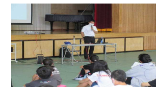
親子学び合い教室