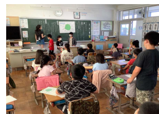
学級活動での話し合い