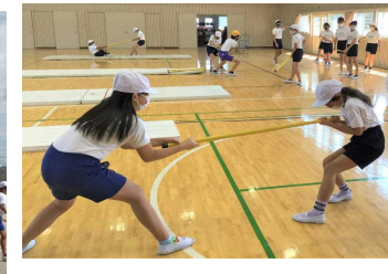
柔軟性アップ運動