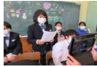
特別支援学級リモート交流会