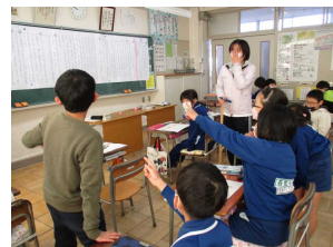
グループ学習での学び合い