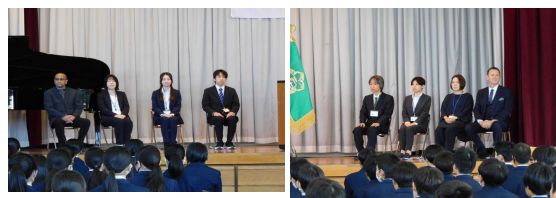
《新しくいらした先生方》

今年度4月に南河内第二中学校に赴任された12名を校長が紹介した後、新任式に参加された8名の先生方からあいさつをいただきました。その後生徒代表が、歓迎の気持ちを伝えました。