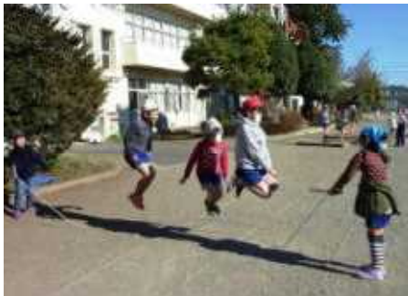
みんなの力を合わせて大縄に挑戦です！