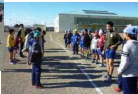
古山オリンピック（こおり鬼）つかまらないように走ります！