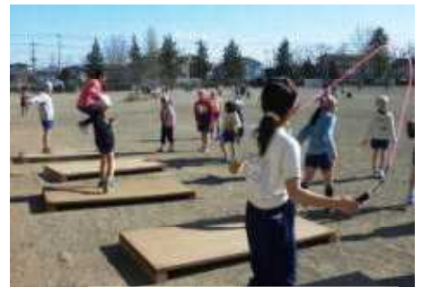
上手に跳べるようになったかな！

古山オリンピックは、今月は「こおり鬼」です。体力をつけて寒さもインフルエンザも吹き飛ばしてほしいですね。