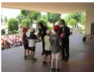
5/19人権の花運動 (集会)