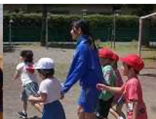
5/25~石橋中学校生徒 職場体験学習