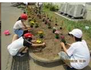
5/20人権の花植え (6年生)