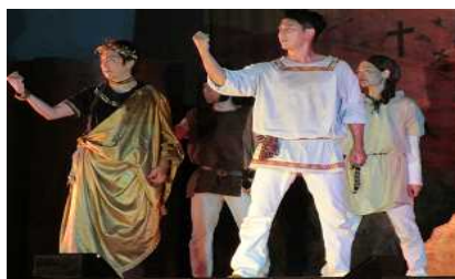
【メロスが王城に戻る】