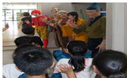
【劇団員全員でお見送り】