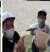
【カブトムシ】【オオムラサキ】