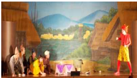
【赤鬼が村人を助ける】

演劇鑑賞会を行いました。低学年は「泣いた赤鬼」を、高学年は「走れメロス」を、鑑賞しました。どちらも「劇団め組」の皆さんによる、素晴らしい演劇でした。目の前での演技を目をキラキラと輝かせ、夢中になって鑑賞していました。本物・美しいもの、そして素晴らしいものに触れることで感動し、想像力が身に付いたと思います。こうした機会がある下野市の教育は、素晴らしいと思います。子どもたちは、大満足の様子でした！