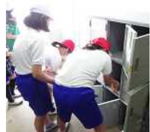
6年生がプールの更衣室をびかびかに!