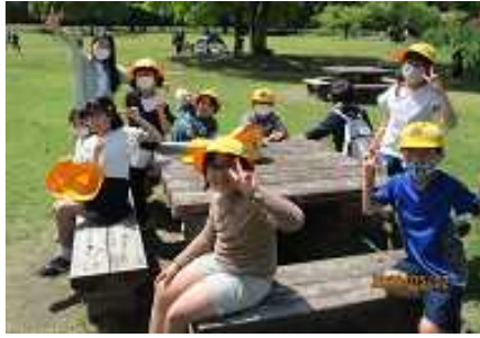
【すっかり意気投合】