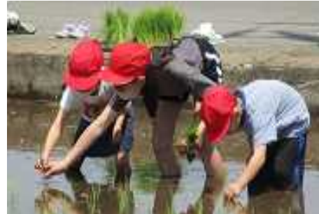
【1年生に手を添える6年生】