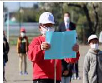
児童代表歓迎のことば 6年 代表児童