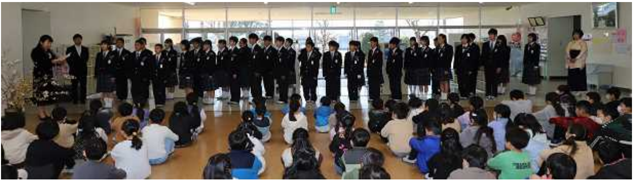
お祝いの会 1~4年生から「お別れのことば」を伝えました