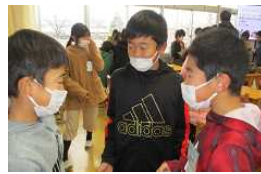
教育実習生の授業