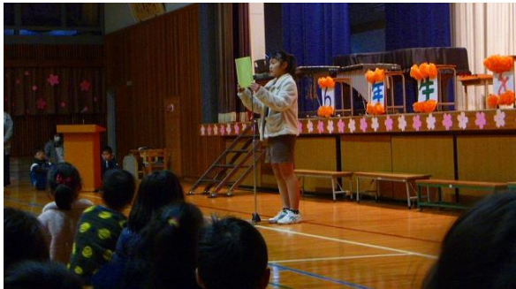
6年生代表のあいさつ