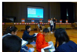
マッチングゲーム