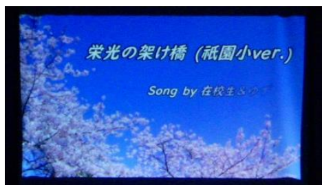
思い出スライドショー