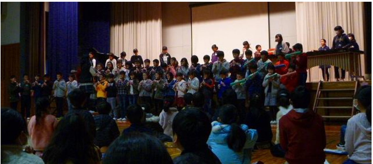
6年生から 「八木節」の演奏