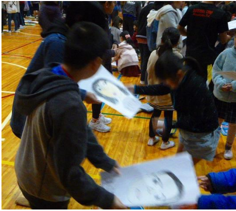
6年生へ似顔絵のプレゼント