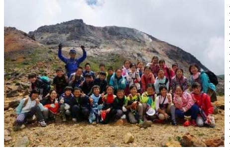
(おいしいお弁当の後の記念撮影、バックの山が那須の茶臼岳、頂上や噴煙が見えます。左から1・2・3組)