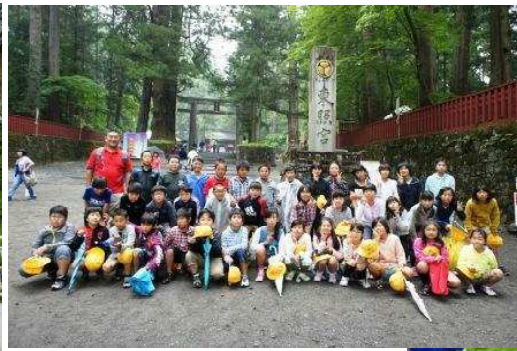
（東照宮参道で5年1組）