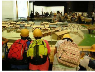
(江戸の町並みのジオラマ)