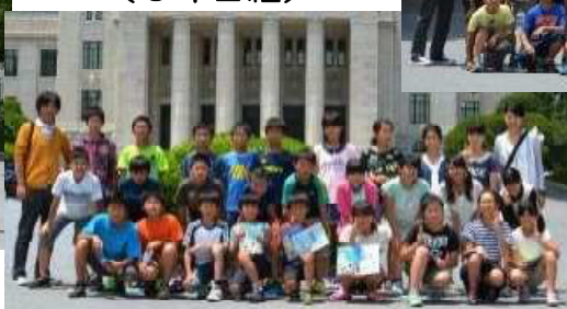
（国会議事堂で記念写真） （6年2組）