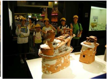
(下野市甲塚古墳のはにわの展示)