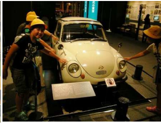
(なつかしのスバル360)