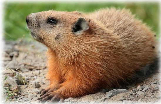
グラウンドホッグ