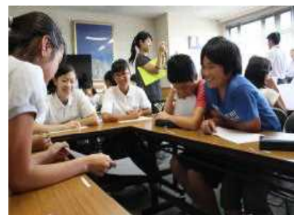
小中学生と一緒に学校の課題を話し合います。