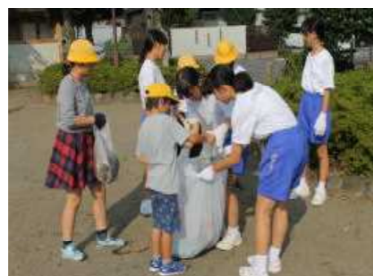
小中学生が力を合わせて学校をきれいにします。