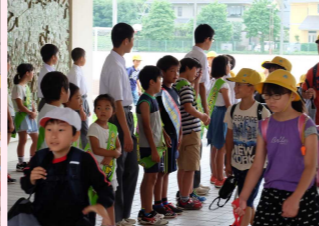
小中交流あいさつ運動