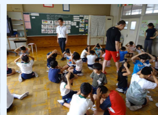
小中教員の相互乗り入れ授業