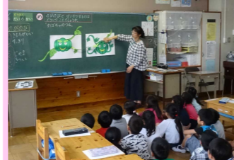
特別の教科道徳の授業